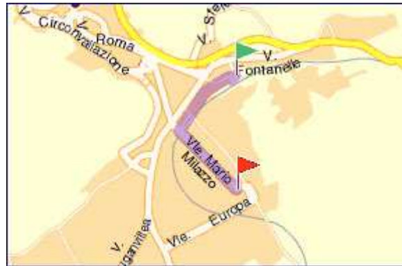
Figura 2 - Mappa riportante il percorso dalla stazione

Dalla Stazione ferroviaria, ubicata in Piazza della Repubblica, girare a sinistra in Viale Sicilia. Girare a sinistra in Rampa Agata Interlandi. Prendere Via Santa Maria Goretti. Prendere Viale Dante Alighieri. Girare a sinistra in Viale Mario Milazzo.